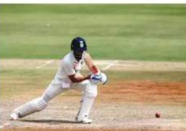
टिकरी के युवक ने कार से लाकर होटल छोड़ा, 17 मिनट रहा कमरे में टेस्ट मैच के फुटेज की

दुबई। आईसीसी पिच और आउटफील्ड निगरानी प्रक्रिया के तहत भारतीय क्रिकेट कंट्रोल बोर्ड (बीसीसीआई) की अपील के बाद इंदौर के होल्कर क्रिकेट स्टेडियम की पिच की रेटिंग को खराब से औसत से नीचे में बदल दिया गया है। होल्कर स्टेडियम की पिच पर भारत और ऑस्ट्रेलिया के बीच आईसीसी विश्व टेस्ट चैंपियनशिप श्रृंखला के तहत तीसरा टेस्ट मैच 1 मार्च से खेला गया था और भारतीय टीम को इस मैच में मात्र सहाय्य दो दिन में ही ऑस्ट्रेलिया के हाथों 9 विकेट से हार का सामना करना पड़ा था।