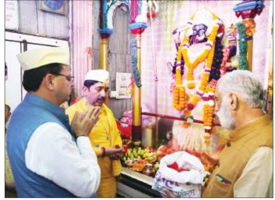
उत्तराखंड के मुख्यमंत्री पुष्कर सिंह धामी ने मां कालिका मंदिर में दर्शन कर समृद्धि की कामना की।

के अलावा आम जनता भी इस प्रक्रिया में भाग ले सकती है और अपनी राय रख सकती है। उन्होंने कहा की ई-विधानसभा बनाने से कामजों की बचत होगी। विधानसभा कार्यों में बहुत से दस्तावेजों का उपयोग किया जाता है, जिनका काफी खर्च आता है। लेकिन ई-विधानसभा के माध्यम से वे दस्तावेज इलेक्ट्रॉनिक रूप से उपलब्ध हो सकते हैं, जिससे कामजों की बचत होती है।